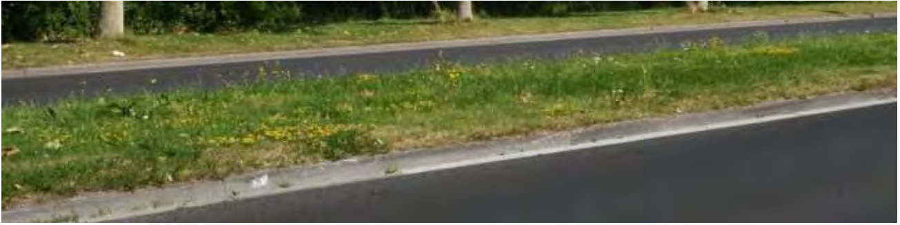
Figuur 3. Deze middenberm laat zien dat als men ‘vergeet’ om te maaien dat het gelijk bloemrijk kan zijn.

ecologisch beheerd. Ik schat in zo’n 5-10 % van de wijk. De rest, het grootste deel, wordt regulier beheerd, wat inhoudt dat het vooral als gazon beheerd wordt en dus frequent, zo’n 20 keer per jaar, wordt gemaaid (Fig. 1).