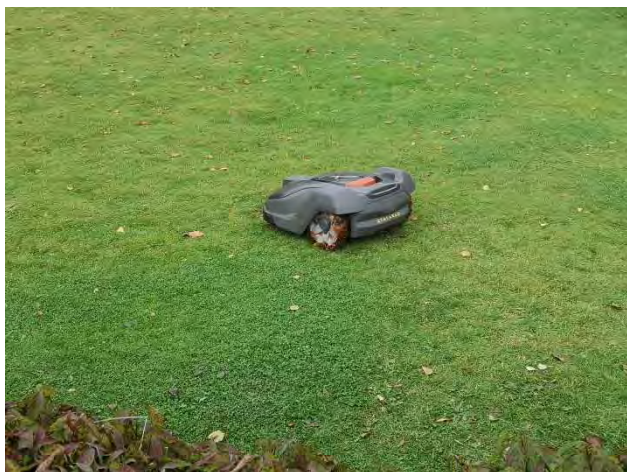
Figuur 10. Robotmaaier, de wel aanwezige rozetten van planten komen niet in bloei.

In mijn eigen wijk wordt het regulier groenbeheer uitgevoerd door de groenvoorziening. In Haren, wat tegenwoordig óók een onderdeel van de gemeente Groningen is, zijn er juist bijzonder veel zéér grote tuinen te vinden. Deze worden veelal onderhouden door vakbekwame hoveniers en anders door de tuineigenaren zelf. Het resultaat is in wezen ongeveer hetzelfde. De grote tuinen met enorme gazons hebben ook daar een groot potentieel om diervriendelijker ingericht te worden. Met name door inrichting met meer inheemse beplanting in de borders en het beheer van gazons. De tuineigenaren zelf zouden de robotmaaier (Fig. 10) vaker kunnen laten staan, zodat ook daar de kruiden meer kansen krijgen om te bloeien én ook zaad te vormen. Voorlichting zou kunnen lopen via de uitvoerende ontwerpers en hoveniers.