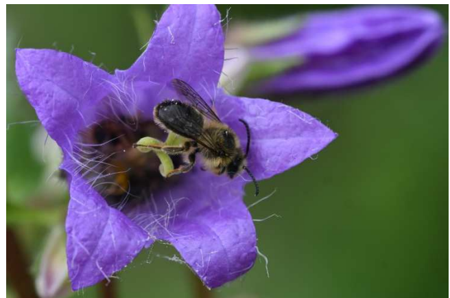
Figuur 7. Man klokjesdikpoot Melitta haemorrhoidalis op ruig klokje.