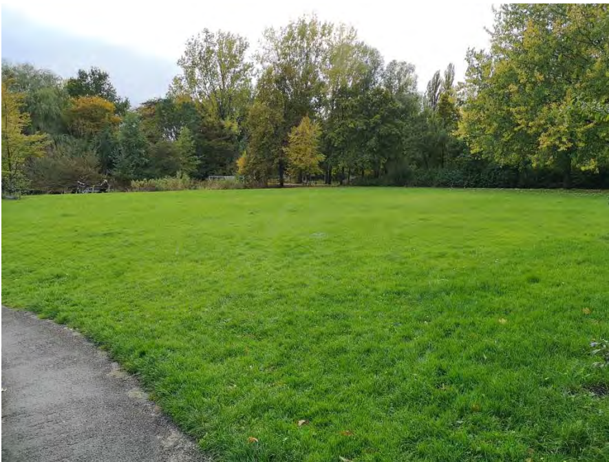
Figuur 1. Frequent gemaaid gazon. Foto Wankja Ferguson.

Ik woon zelf in een van de groenste wijken van Groningen, Beijum, gebouwd in 70-80 er jaren van de 20 ste eeuw. De openbare ruimte van de wijk is zéér groen opgezet. Het bestaat voornamelijk uit aangeplante bomen en struiken, veel (speel)veldjes, bermen en stroken struiken. Met daarnaast natuurlijk de gewone tuinen van de mensen uit de wijk. Vele daarvan zijn tuinen met bloemen. Helaas zijn er ook veel steentuinen, voor de natuur is daar weinig tot niets te beleven. In mijn wijk zijn ook een schooltuin en een aangrenzende openbare pluktuin die biologisch beheerd worden. Daar valt gelukkig véél te beleven. Dat groen verder echter niet automatisch bloemrijk betekent is bij ons in de wijk te zien. Het openbare, groene deel van de wijk wordt voor een klein deel