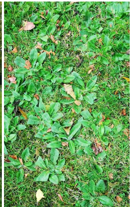
Figuur 2. De potentie om bloemrijk te zijn is er. Er zijn allerlei planten vegetatief aanwezig.