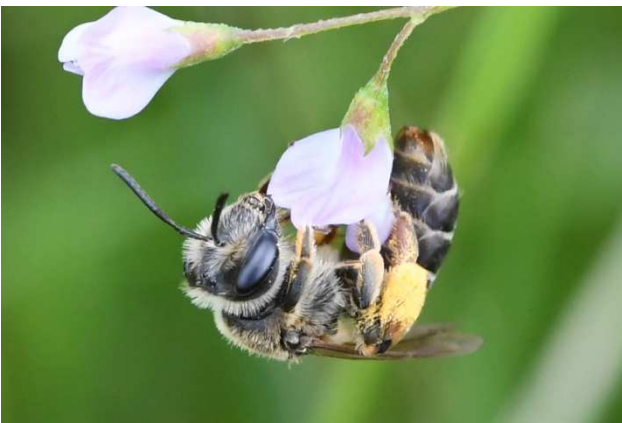
Figuur 4. Geelstaartklaverbij Andrena wilkella op ringelwikke.

Er zijn zo’n 80 stuifmeelspecialisten (oligolectisch) onder de bijensoorten. Deze bijen hebben stuifmeel van één soort plant of van één plantenfamilie nodig. Voorbeelden zijn de geelstaartklaverzandbij Andrena wilkella (Fig. 4), hoofdvliegtijd: mei en de klaverdikpoot Melitta leporina , hoofdvliegtijd: juli, augustus. Ook zijn er beperkt stuifmeelspecialisten (beperkt polylectisch), deze kunnen wel van meerdere plantenfamilies gebruik maken, maar vertonen een zéér sterke voorkeur voor één plantenfamilie. Voorbeeld is de andoornbij Anthophora furcata met een zéér sterke voorkeur voor lipbloemigen, hoofdvliegtijd: mei én een tweede periode in augustus. Solitaire bijen hebben vaak een maar zeer beperkte