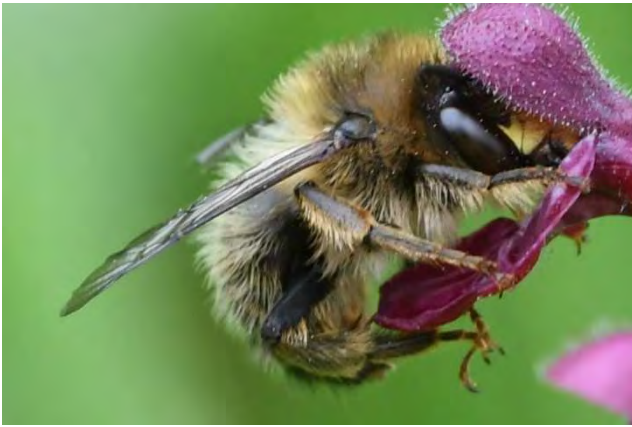
Figuur 8. Man andoornbij Anthophora furcata .

voor het boomblauwtje Celastrina argiolus . Er zijn vele houtwalachtige bosschages in de wijk. Toch zijn er maar enkele plekken waar de bosandoorn, de diverse dovenetels en bijvoorbeeld primula's en daslook en ook voorjaarplanten zoals longkruid een plekje in deze houtwallen vinden. De andoornbij, die wél in de pluktuin voorkomt, zie ik daarbuiten niet en de gewone sachembij Anthophora plumipes zou er ook baat bij hebben. Geraniumsoortjes zoals de donkere- en beemdooievaarsbek en smeerwortel handhaven zich plaatselijk prima in de berm en in mijn wijk, dus zouden vaker toegepast kunnen worden. Ze leveren veel nectar aan veel bijensoorten. Niet alleen de bloeiende planten ontbreken in de wijk, ook wordt er té veelvuldig gemaaid om de bovengrondse nesten van de soorten als grashommel en moshommel in de meer grassige berm en veldjes