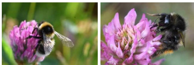
Figuur 12. Tuinhommel Bombus hortorum en grashommel Bombus ruderals .

Gewapend met mijn tabellen en zéér rijk geïllustreerde power points van zelf gemaakte foto's (Fig. 12) en kennis die ik door eigen verdieping heb opgedaan, verzorg ik nu cursussen aan zowel de Ontwerpacademie in Hazerswoude als bij Terra Next in Eelde. Met het geven van deze cursussen bereik ik deels ontwerpers en hoveniers en ook geïnteresseerde particulieren. Ik werk daarbij samen met Jaap Mekel, die het onderdeel maaibeheer verzorgt. Ook zouden bedrijven een in company cursus bij mij kunnen aanvragen (te vinden op mijn website https://www.vlindererbij.nl/cursus-wilde-bijen-en-dagvlinders-hun-planten-en-beheer-voor-professionals/ ). Die valt dan heel voordelig voor het bedrijf uit omdat mijn cursus erkend wordt door Colland, een organisatie die subsidies verstrekt aan de deelnemers bij cursussen die georganiseerd worden door de beroepsgroep zelf.