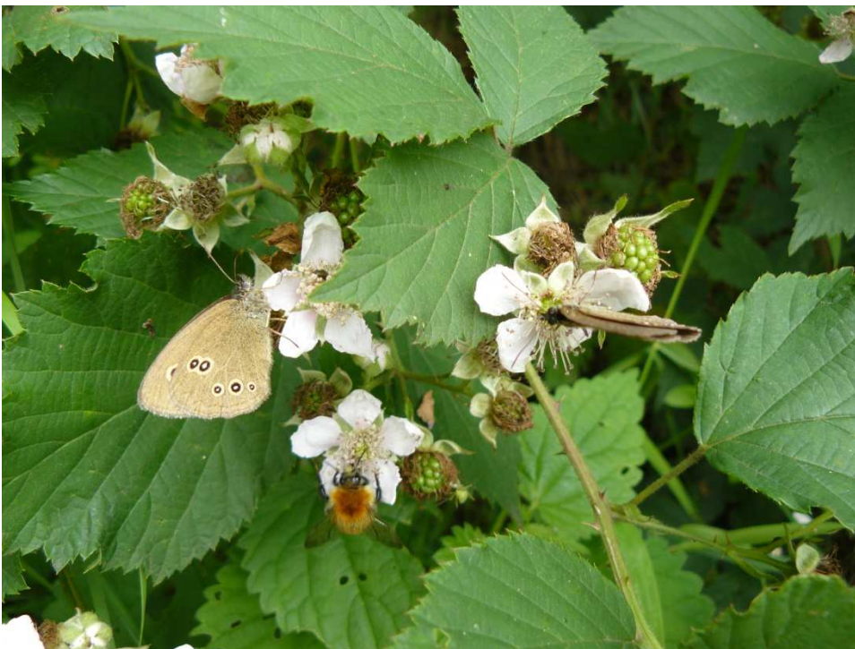
Figuur 9. Akkerhommel Bombus pascuorum en koevinkjes Aphantopus hyperantus foeragerend op braam.

Volgens mij zijn de berm en groenstroken in mijn wijk qua plantensoorten vergelijkbaar met het stedelijk groen in Winschoten. Daar is het beheer anders. De gemeente laat daar langer de kruiden in de berm staan, zodat ze kunnen bloeien. Hierdoor vind je er beduidend meer bijensoorten. Met name de stuifmeelspecialisten die klaversoorten nodig hebben profiteren ervan.