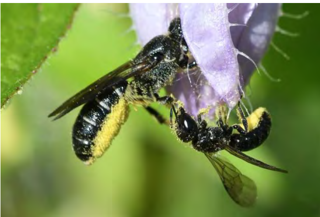
Figuur 6. Grote klokjesbij Chelostoma rapunculi en kleine klokjesbij Chelostoma campanularum op ruig klokje.

Hoewel sommige oevers recentelijk mooi glooiend uitgegraven zijn, is er geen grote wederik of kattenstaart te vinden. Deze planten zouden heel goed in deze oevers kunnen voorkomen, bloeien mooi en opvallend en zijn een voedselbron voor bijvoorbeeld de gewone slobkousbij Macropis europaea . De slobkousbij komt in mijn wijk wel voor, ik heb haar wel een keer gevonden foeragerend op een akkerdistel. Ze zou echter in grotere getalen voor kunnen komen, als de beplanting en het beheer van het gemeentelijk groen anders zou zijn. Voor de kattenstaartdikpoot Melitta nigricans is Groningen misschien wat te noordelijk, niettemin ook vele andere bijensoorten zijn gek op de kattenstaart en het is ook een waardplant