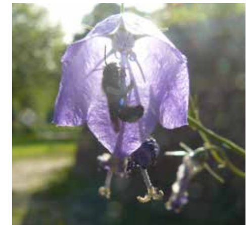
Grote klokjesbij vindt onder het grasklokje ook een schuilplek bij regen.