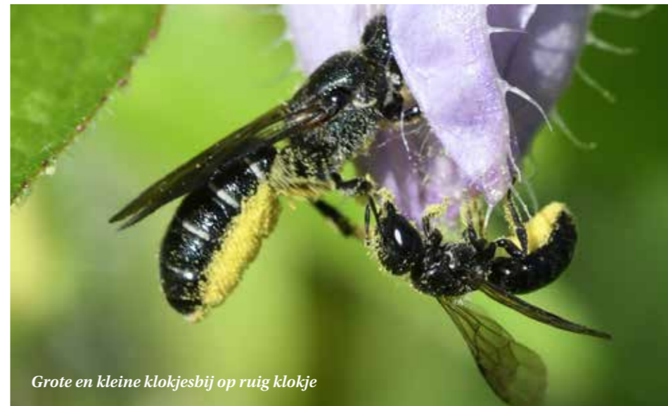
Grote en kleine klokjesbij op ruig klokje